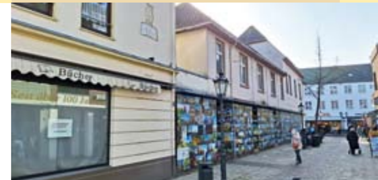
Die Wissink-Ecke an der Burgstraße bekommt ein neues „Gesicht“.

Ende 2020 lief die letzte Prinzenrolle vom Band, seitdem gehört die Kempen-Ära als Produktionsstandort des Keksherstellers Griesson – deBeukelaer nach 65 Jahren der Vergangenheit an. Nachfolgepläne des aus Sicht der Wirtschaft „Filetgrundstücks“ für Kempener Gewerbesiedlungen sind seitdem nie so konkretisiert worden, dass wieder Betrieb in die acht Hektar große Industriebrache in Bahnhofsnähe gekommen ist.