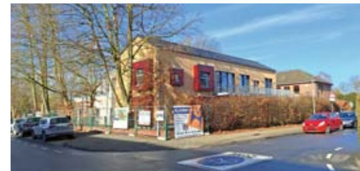
Die Kita „Kleine Hände“ neben der Thomaskirche ist gewachsen.