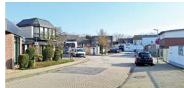
Bekommt die Volksbank bald Rosen-Gärten in der Nachbarschaft?