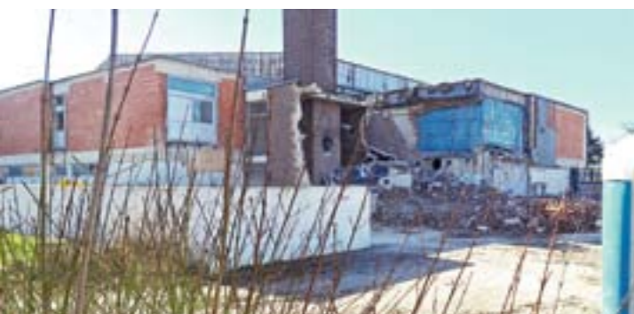
Die alte Schwimmhalle am Aqua Sol wird abgerissen, vom Hotelneubau noch keine Spur.

Am Burgring 17 hat die Volksbank Kempen-Grefrath vom Architekturbüro Thelen ein Mehrfamilienwohnhaus mit vier Mieteinheiten errichten lassen. Hinter dem Haus mit heller Putzfassade sind zudem drei Garagen entstanden. Entsprechend den Denkmaltvorgaben der Stadt ist alles hochwertig gestaltet, u.a. mit Natursteinbodenbelägen in allen Treppenhäusern, massive Eichenholz-Handläufe, Innenfensterbänke aus Naturstein sogar eine Eingangstür aus Holz. Das dreigeschossige Haus ist bezugsfertig.