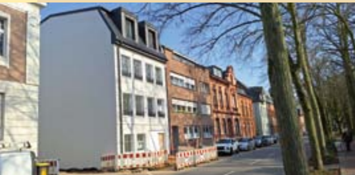
Am Burgring 17 ist im sensiblen Denkmalbereich ein Neubau entstanden.