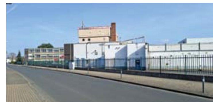
Seit gut fünf Jahren tut sich nichts mehr auf dem deBeukelaer-Areal.