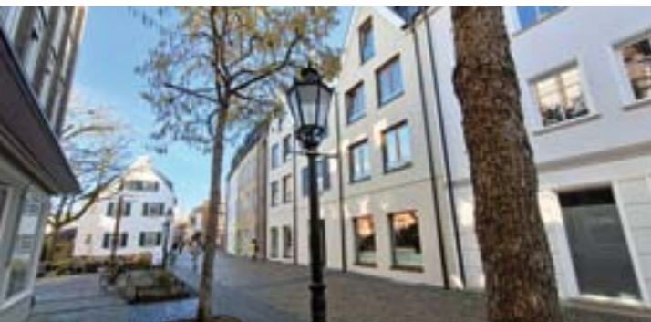
In die Ladenzeile Ellenstraße 11-14 kommt jetzt Bewegung.