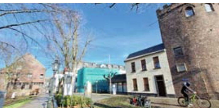
Am Wachhäuschen neben dem Peterturm wird das Dach saniert.